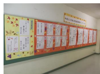
今年の読書標語の入賞者は？