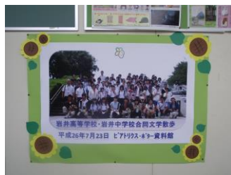
文学散歩集合写真

10月には芸術鑑賞会があります。今年は会場を坂東市民音楽ホール（ベルフォーレ）にし、「リズム&コメディショー Tap Do!」を行う予定です。図書委員が開会と閉会行事を中心になって行います。その他、読書週間標語コンクールもあります。それぞれ担当職員を中心に準備を進めています。