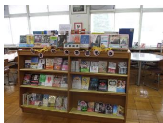
今話題の新刊本もたくさん入荷中