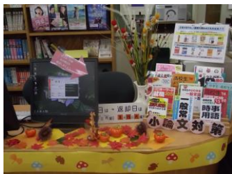
カウンターに置かれた秋飾り

夏休みが終わり、2学期が始まりました。図書館も夏から秋への模様替えをしました。赤や黄に色づいたモミジやイチョウの葉、毬栗（いがぐり）や柿の置物がカウンターの付近を飾っています。また、夏休み中に貸し出されていたたくさんの本が、図書館に戻ってきました。今話題の新刊本もぞくぞく入荷しているの、生徒だけでなく職員も本を借りに来ています。「どうすれば人は幸せに生きることができるか」をテーマにした『嫌われる勇気』や『マンガでやさしくわかる アドラー心理学』などの本も人気です。