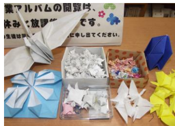
幸せを運ぶカメやツル