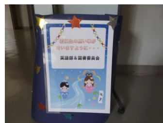
夢が叶いますように！