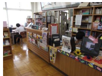
カウンター当番の生徒たち