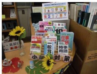
小論文・面接対策コーナー