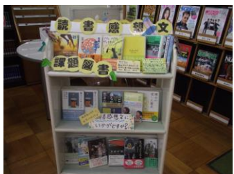
読書感想文 課題図書