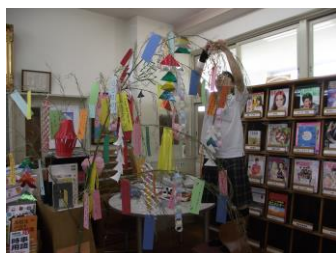
図書館で飾り付け

今年も図書委員会と英語部合同で七夕の笹飾りを作りました。図書館内に設置した笹に、願い事を書いた短冊を飾りました。「就職活動がうまくいきますように」「車の免許が一発でとれますように」「Please may I have a happy Year!」「World Peace」……など、様々な願い事が色とりどりの紙に書かれました。数日後、職員玄関に笹飾りを移動し、そのそばに短冊とペンを置いておくと通りがかった多くの生徒や職員が願い事を書いてくれました。