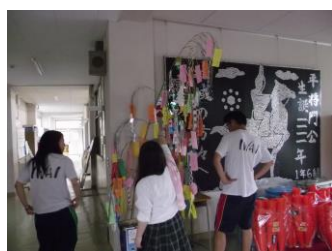
笹飾りを職員玄関へ移動