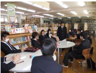
次期委員長から祝辞

図書委員会の3年生を送る会を2月27日の放課後、図書館で行いました。2年生が『卒業お祝いポプラ』（第462号）を作成し、3年生に贈りました。2年生の次期図書委員長が代表して祝辞を述べ、その後、3年生が一人ひとりお別れの挨拶をしました。最後に3年生の委員長が、お礼の言葉と委員会活動を通して学んだことを話してくれました。図書委員会の良き伝統が今年度も後輩たちに引き継がれました。