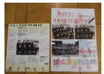
卒業お祝いポプラ