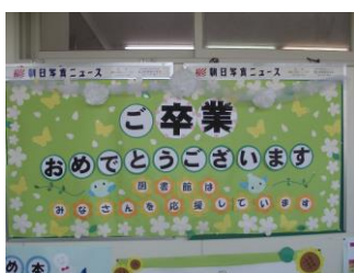
卒業を祝うコーナー

年度当初計画した図書館行事はすべて実施することができました。窓の外はまだ北風が吹いていますが、日の光からは春の気配が感じられます。