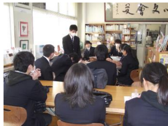
3年生からお別れの挨拶