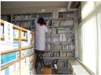
点検作業に励む図書部の職員

2月2日から2月18日まで蔵書点検を行いました。館内にある約3万冊の蔵書を図書部の職員6名がバーコードリーダーで1冊ずつ点検しました。本を出し入れするとかなりの塵ほこりが舞うので、マスクを着け軍手をはめての作業でしたが、珍しい本を発見して思わず数ページ読んでしまうこともあります。蔵書点検の結果、今年になってからの不明本は14冊ですが、生徒に人気のあるライトノベルや漫画本が一冊も紛失していませんでした。また、傷んだ本や古い本などは廃棄処分にし、より利用しやすくなるように書架を整備しました。