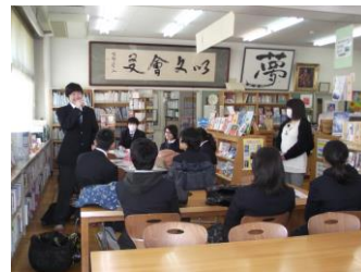
委員長からお礼の言葉